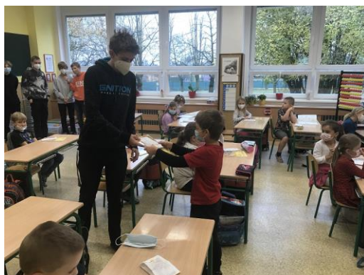
Třídní učitelky prvňáčků

Se slavnostním předáváním SLABIKÁŘŮ pomohli žáci devátých tříd. Naši velcí kamarádi předali učebnice a malé dárečky ale až poté, co prvňáčci dokázali samostatně přečíst celé slovo. Mnohé děti trošičku potrápila tréma, ale nakonec všichni dokázali, že mohou přejít do dalšího – tentokrát už čtenářského období první třídy. Držme našim nejmenším čtenářům všechny palce!